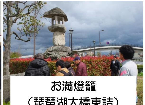
お満燈籠 （琵琶湖大橋東詰）