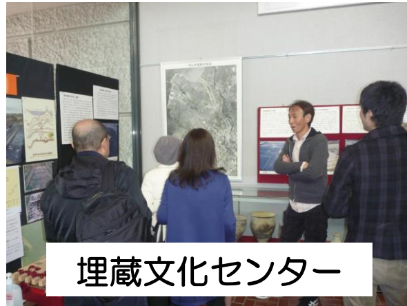
埋蔵文化センター