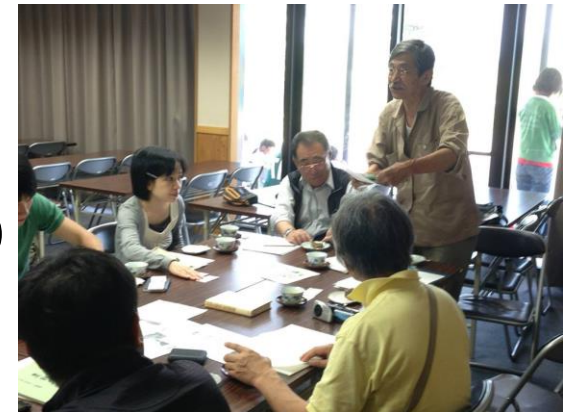
でんくうの会との協働

今後の課題 現在活動されている語り部の方との連携 多くの方に聞いていただく語り部の会の実施